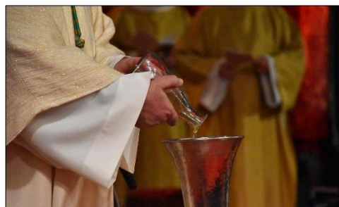
L'Évêque verse le parfum dans l'urne déjà remplie d'huile pour la confection du Saint-Chrême

On cherche des volontaires pour assurer le service. Les personnes disponibles peuvent se signaler au Secrétariat de l'Unité pastorale ou à Eddy, le sacristain de St-Christophe.